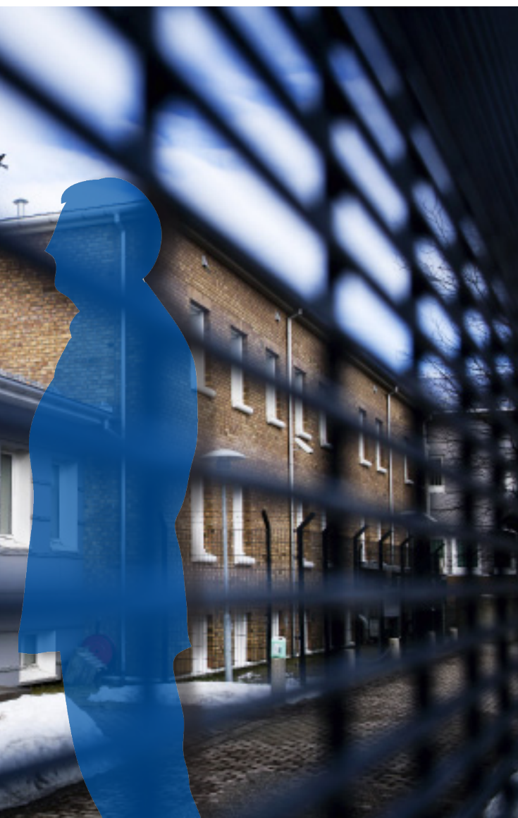
Illustrasjon: LO Media

«Årsak-virkning-tenkningen preger i stor grad et lukket fengsel, atferd får konsekvenser uansett årsak.»