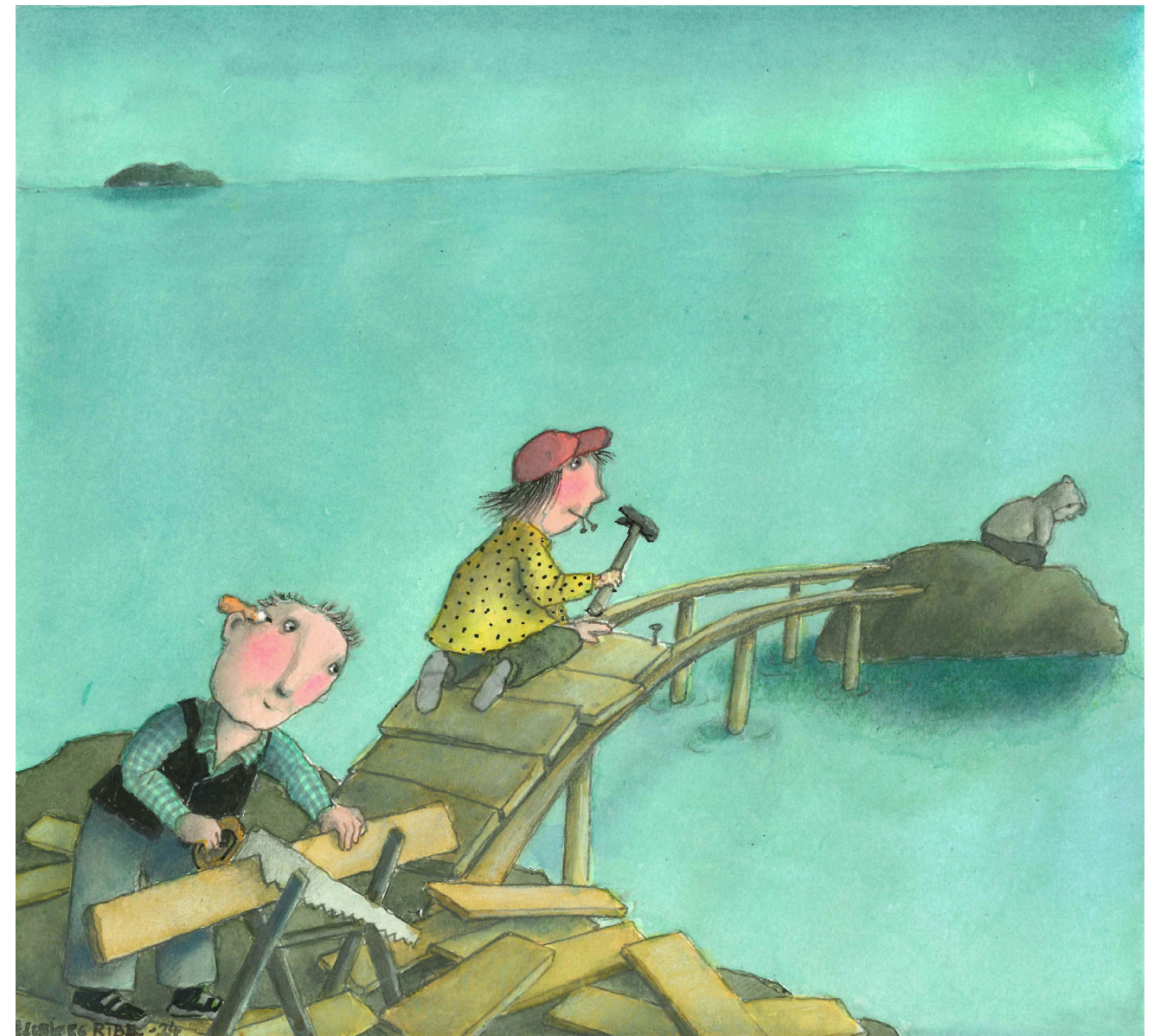
Illustrasjon: Eldbjørg Ribe

Artikkelen utforsker oppsøkende sosialarbeideres kontakt med marginaliserte unge, og er basert på materiale samlet inn gjennom fokusgruppeintervjuer med åtte deltagere. Oppsøkende sosialarbeideres rolle som brobyggere mellom marginaliserte unge og hjelpeapparatet får her et særlig fokus, og i artikkelen konkretiseres hva som ligger i dette gjennom begrepene fremsnakking, oversetting og videreformidling. Utøvelsen av dette arbeidet diskuteres i lys av teori om sosial kapital. Å snakke frem både ungdommene og hjelpeapparatet, å oversette mellom ungdommene og hjelpeapparatet, for slik å legge til rette for videreformidling til andre instanser fremheves som mulige måter å utvikle brobyggende sosial kapital.